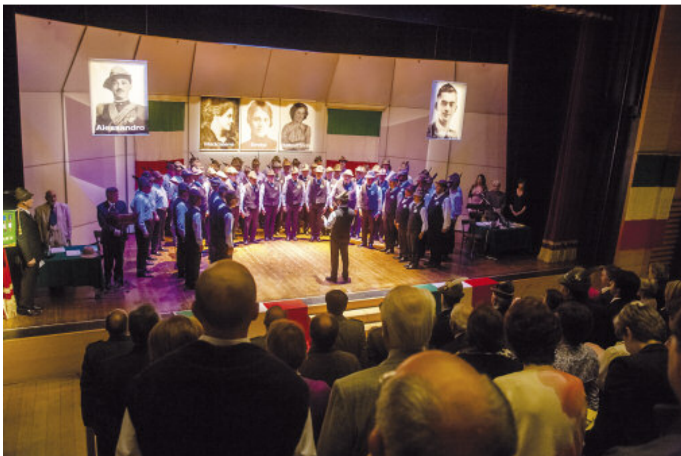
I cori riuniti sul palco sotto le foto dei Tandura e la sala del teatro.

D ue Medaglie d'Oro al Valor militare, quattro d'Argento e una Croce al merito di guerra distribuite fra i cinque esponenti della famiglia. È quella dei Tandura di Vittorio Veneto, tra le più decorate famiglie d'Italia, che è stata al centro di una straordinaria serata al teatro Lorenzo Da Ponte, presenti fra gli altri, il vescovo mons. Corrado Pizziolo e il vice presidente nazionale dell'ANA Nino Geronazzo. Storia della prima e della seconda guerra, narrativa, musica, cori e altro ancora hanno percorso una frazione del Novecento.