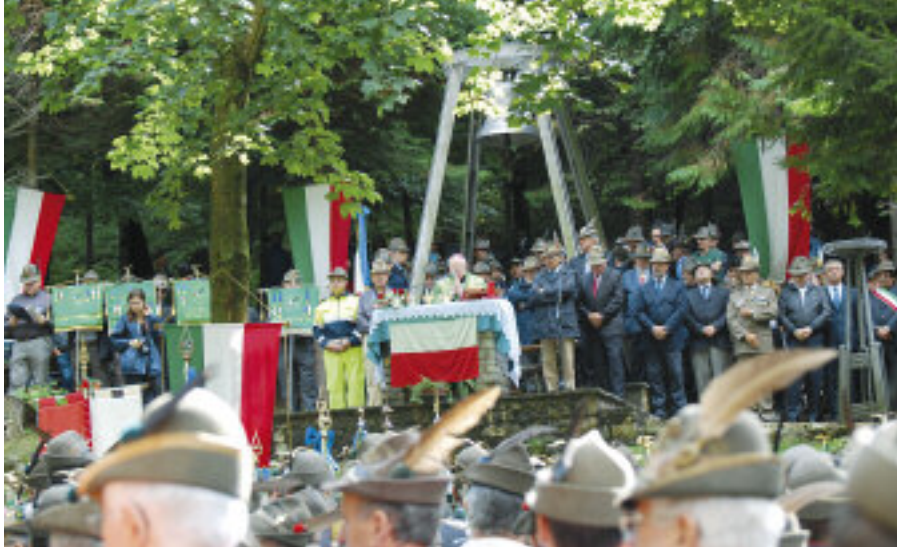
La celebrazione della Messa officiata dal vescovo emerito di Trieste mons. Ravignani.

appello a sostenere il Paese in un momento di grave difficoltà, auspicando che “non vengano mai meno speranza e impegno per uno sviluppo ordinato, convivenza seria, pacifica e rispettosa di ogni essere umano”. Il vescovo ha concluso esortando i “veci” e i “bocia” affin-