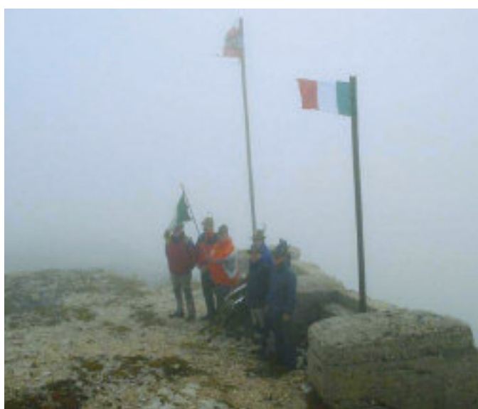
Il Dente italiano e il Dente austriaco: una croce e un cippo ricordano i Caduti sui due fronti.

L a magia del Pasubio nasce dalle piccole, esili, stelle alpine che spuntano nei recessi della roccia. È la vita che si rinnova umile nei luoghi dove la morte bussava al sibilo dei proiettili dei Mauser o dei '91; laddove il tempo e lo spazio erano sanciti dai colpi degli obici, dalle mine e dalle trincee, scavate anch'esse nella roccia.