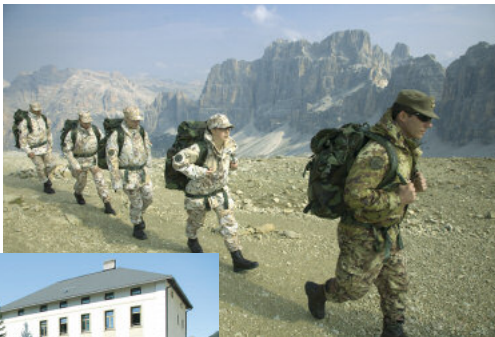
In marcia sul Lagazuoi.

Topografia, primo soccorso, sopravvivenza e movimento in montagna sono alcune delle prove con cui si sono cimentati i partecipanti, seguiti dagli istruttori militari del Centro Addestramento Alpino di Aosta e del 6° Alpini di Brunico.