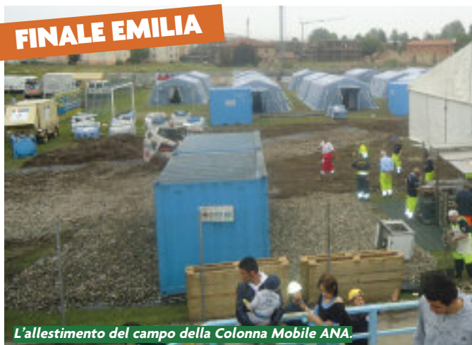
L'allestimento del campo della Colonna Mobile ANA.