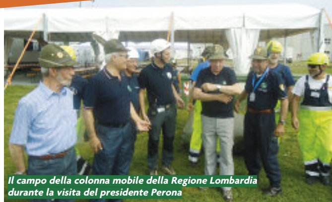
Il campo della colonna mobile della Regione Lombardia durante la visita del presidente Perona