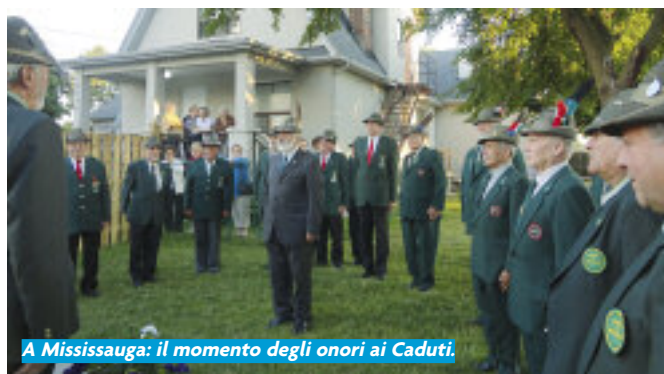
A Mississauga: il momento degli onori ai Caduti.