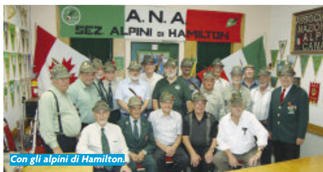
Con gli alpini di Hamilton.

terventi e gli scambi di doni in un clima fraterno. "Il consiglio nazionale non vi abbandona - ha concluso Minelli prima del commiato - continuate a trasmettere i valori alpini". Nel suo viaggio in Canada, Minelli ha visitato anche gli alpini di Toronto, gli alpini del gruppo di Mississauga, quelli di Hamilton e di Montreal. Ovunque ha avuto la stessa impressione: gli alpini all'estero hanno l'Italia nel cuore e chiunque rimanga con loro anche solo per poche ore, riceve molto di più di quello che può dare. ●