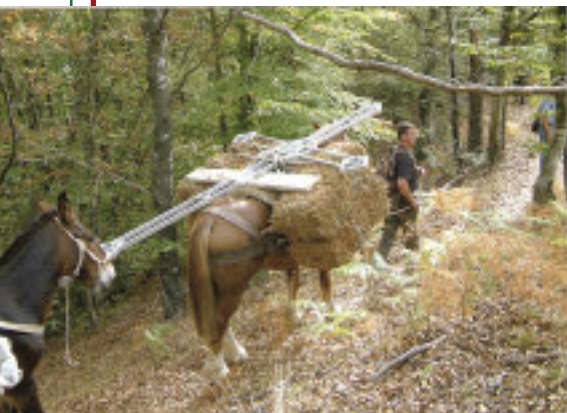
Il trasporto della croce e la foto ricordo sul Poggio Alto.

“ A Montale (Pistoia) se gli alpini non ci fossero bisognerebbe inventarli”. Così ha scritto Giacomo Bini, su La Nazione e su un giornale locale degli alpini di quel Gruppo che da anni svolgono un lavoro sociale importantissimo per la comunità.