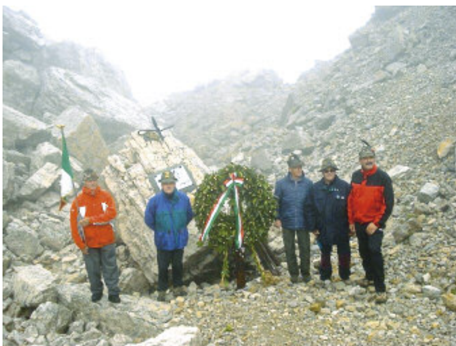
La lapide al masso posto sul fronte della disastrosa frana precipitata nella notte fra il 4 e il 5 settembre 1917 che travolse i baraccamenti del btg. Aosta e di altri reparti. Persero la vita il col. Ernesto Testafochi, 105 alpini e altri cento soldati. Di molti, ancor oggi, la montagna conserva i corpi.

Il Pasubio è tutto qua, terra di confine fin dalla Repubblica Serenissima. Alle porte, scolpito nella roccia, è possibile vedere ancora ciò che resta di un leone di San Marco. È un massiccio inospitale, senz'acqua, senza ripari, che possiede la stessa bellezza delle gavette di latta in dotazione ai soldati che dal 1916 al 1918 furono attori di assalti infiniti e complesse opere ingegneristiche. Cioè nessuna. Qui ogni prima domenica di settembre la sezione di Vicenza organizza l'annuale pellegrinaggio; un'ideale professione di fede in ricordo dei soldati, non solo alpini, non solo italiani, non solo cristiani,