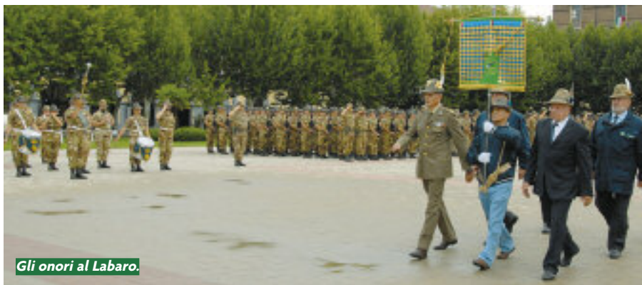
Gli onori al Labaro.

Ed ecco spuntare dietro la fila degli alberi la prima Compagnia, seguita via via