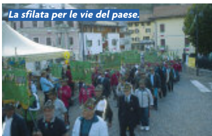
La sfilata per le vie del paese.

Al primo posto nelle quattro classifiche del Campionato davanti ai trentini