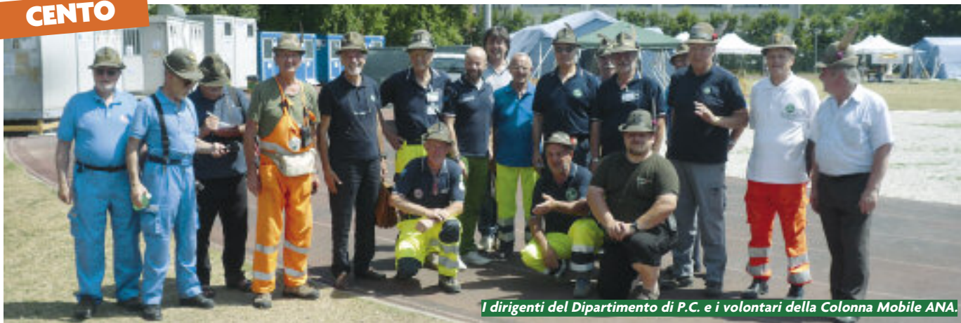
I dirigenti del Dipartimento di P.C. e i volontari della Colonna Mobile ANA.