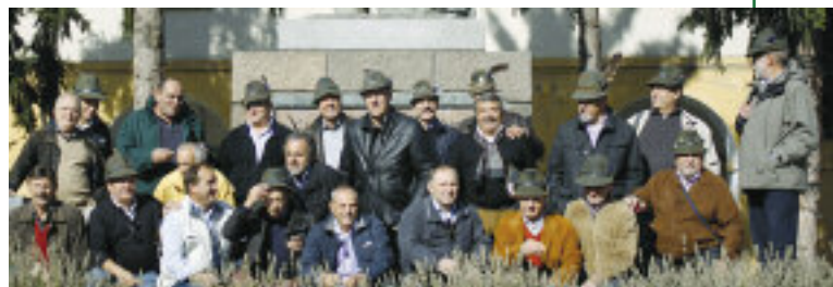
Alpini del 2 o reggimento a Cuneo, anni 1970-71, durante una rimpatriata alla caserma Cesare Battisti.