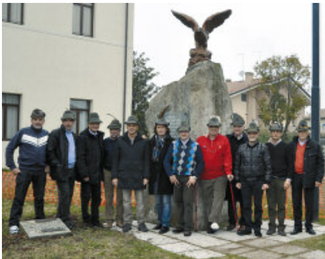
Quarant'anni fa erano autisti del 3°/51 alla caserma Goi di Gemona del Friuli, Reparto Comando del 3° da montagna della Julia. Oggi si sono ritrovati davanti alla sede del gruppo di Albignasego (Padova).