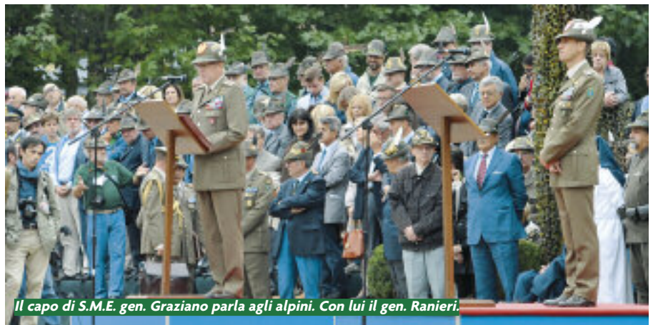
Il capo di S.M.E. gen. Graziano parla agli alpini. Con lui il gen. Ranieri.

ni di vita normali. Sanno che ci saranno rischi ogni giorno, che ogni perlustrazione, controllo del territorio sarà a rischio, che perfino l'addestramento dei militari afgani potrà riservare sorprese. Eppure sono sereni, perché sono responsabili e sanno che la delicata fase di transizione nella provincia di Herat e di Bala Mourghab di trasferimento di responsabilità alle forze afgane comporta anche imprevedibili. Lo ha detto anche il capo di Stato Maggiore dell'Esercito, generale Graziano, nel suo saluto agli alpini della brigata, quando ha ricordato che "saranno sei mesi di impegno e di concentrazione". Perché il momento di transizione della responsabilità alle forze afgane è tanto più delicato "in aree in cui l'insorgenza e la criminalità sono ancora fonte di grande instabilità". Per gli alpini questa realtà non è nuova, è la loro quarta missione in Afghanistan. "Avete uno straordinario livello di preparazione, siete una delle brigate di punta dell'Esercito, un esempio di cooperazione con le forze francesi, modello per tutti i Paesi della Nato", ha rimarcato il capo di SME. "Ciascuno di voi non sarà solo un