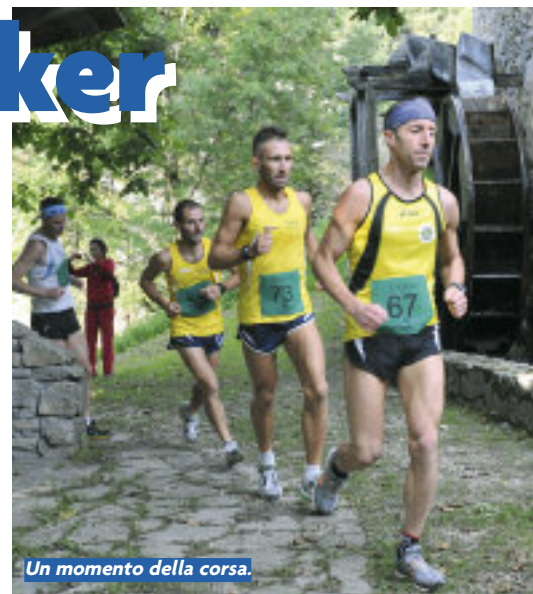
Un momento della corsa.

Hanno partecipato alla gara quattro squadre del 7° reggimento Alpini. Con queste premesse scontato il primo posto dei bellunesi nella classifica per sezioni trofeo "Ettore Erizzo" davanti a Trento, Pordenone, Cadore e Bergamo. La cerimonia di apertura svoltasi sabato 15 ha